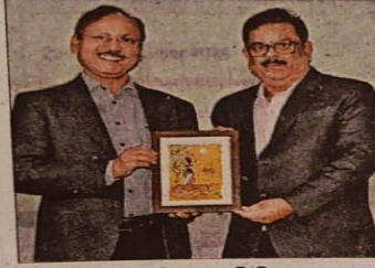
कॉन्फ्रेंस में उपस्थित अतिथिगण.